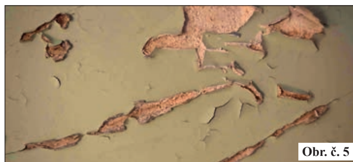
Obr. č. 5