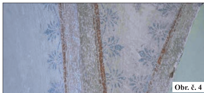
Obr. č. 4